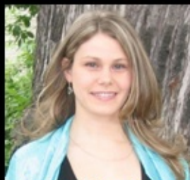
Sandman Emilie orthopédie