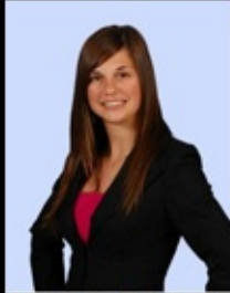
Beauregard Totaro Caroline chirurgie cardiaque