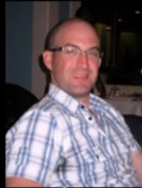
Hylands Éric orthopédie