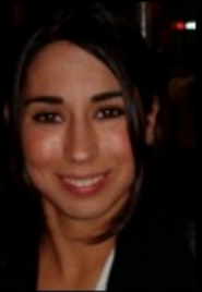
St-Supery Veronique Plastic