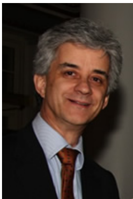
Titulaire de la Chaire