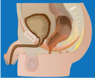
Forme basse Fistule recto-périnéale