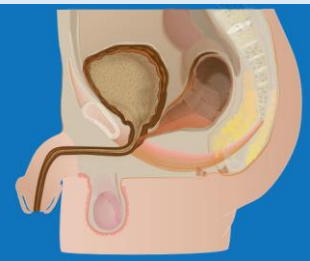
Forme haute Fistule recto-urétrale