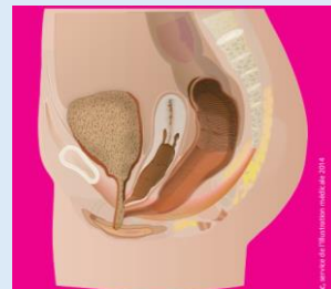
Forme haute Cloaque