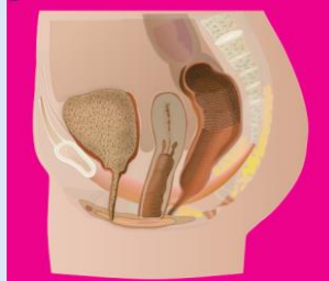
Forme basse/intermédiaire Fistule recto-vestibulaire