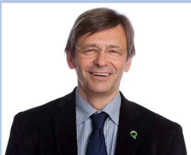
MOT DU DIRECTEUR